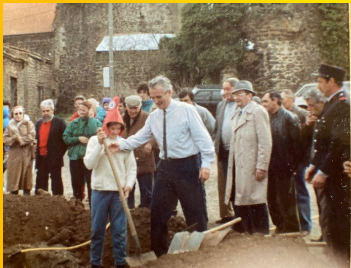
Plantation de l'arbre de la liberté 1989 - Bicentenaire de la révolution

J'ai donné à la collectivité ce que je pouvais lui donner »