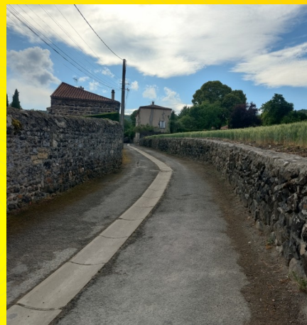
Réfection du mur Chemin de la Motte