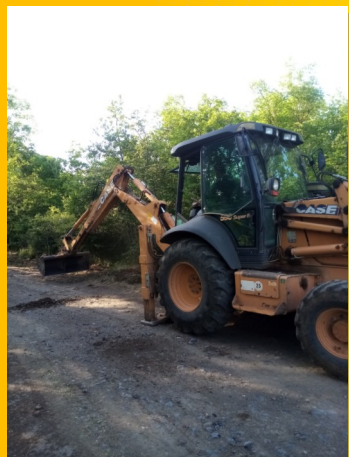
Chaussée chemin des Quinzes

Différents travaux ont été effectués sur le territoire de la commune ces derniers temps :