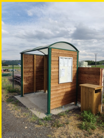
Déplacement et embellissement de l'arrêt de bus de Civrécac